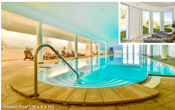
Indoor-Pool (18 x 6.5 m)