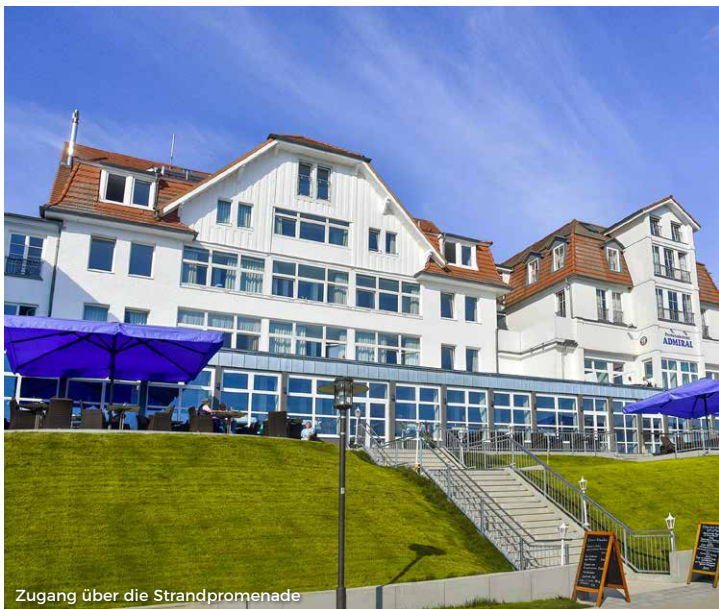
Zugang über die Strandpromenade