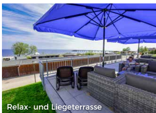
Relax- und Liegeterrasse