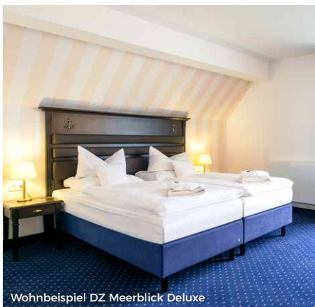
Wohnbeispiel DZ Meerblick Deluxe