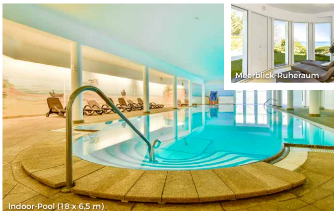
Indoor-Pool (18 x 6,5 m)