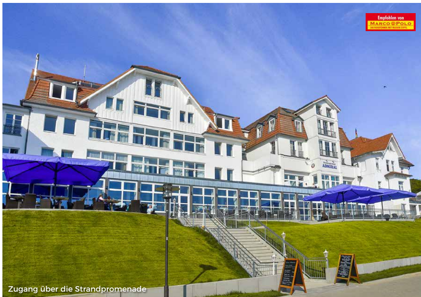
Zugang über die Strandpromenade