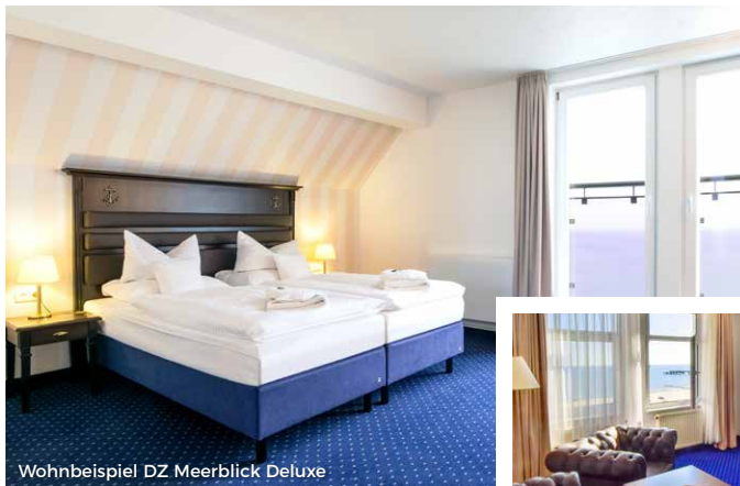
Wohnbeispiel DZ Meerblick Deluxe