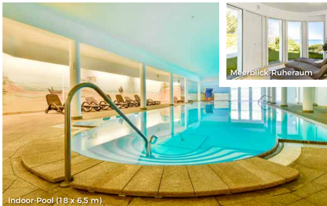
Indoor-Pool (18 x 6,5 m)